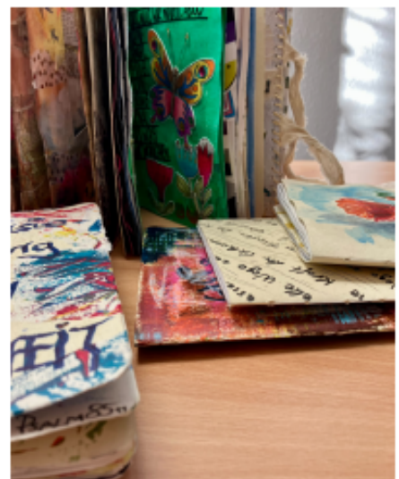
Sketchbooks aus dem Kunstprojekt Justice.Peace.Imagination.

Hunderte Menschen weltweit, die sich künstlerisch ausdrücken, haben ganz individuelle kleine Kunsthefte im A5-Format, sogenannte Sketchbooks, gestaltet. Sie haben nach Spuren von Gerechtigkeit und Frieden in ihrem Leben gesucht. Sie stellen dar, was möglich wird, wenn die eigene Vorstellungskraft eine Bedeutung erhält. Sie haben Bilder von unserer Welt entworfen - wie sie aussieht, wenn Frieden und Gerechtigkeit in ihr sind. Daraus ist eine Ausstellung entstanden. Die Sketchbooks dürfen betrachtet und erlebt werden. Die Idee dabei: das, was in den Sketchbooks