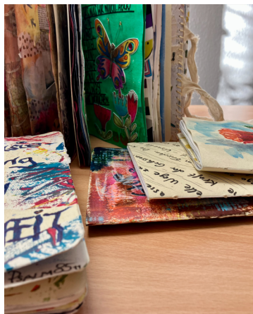
Sketchbooks aus dem Kunstprojekt Justice.Peace.Imagination.

Hunderte Menschen weltweit, die sich künstlerisch ausdrücken, haben ganz individuelle kleine Kunsthefte im A5-Format, sogenannte Sketchbooks, gestaltet. Sie haben nach Spuren von Gerechtigkeit und Frieden in ihrem Leben gesucht. Sie stellen dar, was möglich wird, wenn die eigene Vorstellungskraft eine Bedeutung erhält. Sie haben Bilder von unserer Welt entworfen - wie sie aussieht, wenn Frieden und Gerechtigkeit in ihr sind. Daraus ist eine Ausstellung entstanden. Die Sketchbooks dürfen betrachtet und erlebt werden. Die Idee dabei: das, was in den Sketchbooks passiert, hat auch mit jeder und jedem von uns zu tun! Deshalb lädt die Ausstellung ein, die Welt mit den Augen der anderen zu sehen und sich dabei über das "Anschauen" selbst auf die Suche nach Bildern von Gerechtigkeit und Frieden zu machen.